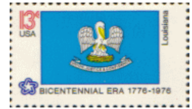
アメリカ合衆国ルイジアナ州旗